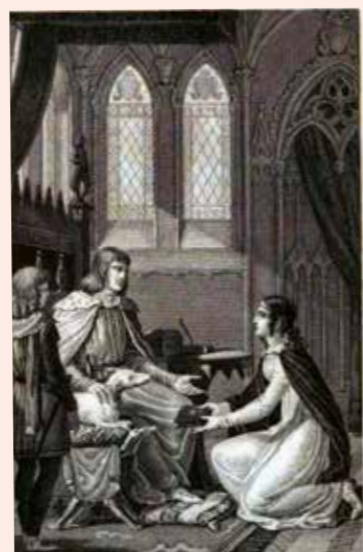
"Marie de France ger sin diktsamling till Henrik II" av Charles Abraham Chasselat, ca. 1820.

Marie de France dikter handlar framförallt om kärlek och lust. Kärleken är