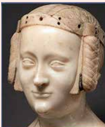
Marie de France i Oxford Dictionary of National Biography . Byst i marmor, ca. 1381.

Verklighetens Marie de France var en författare som var vida känd under sin livstid och vars verk haft stor påverkan på europeisk litteratur. Hittills har fyra verkssamlingar tillskrivits henne. Mest känd