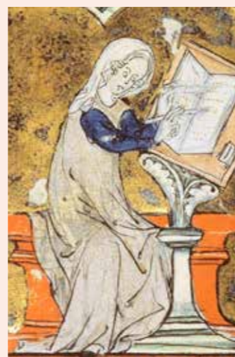
Marie de France avbildad i ett illustrerat manuskript i Frankrikes nationalbibliotek.

att särskilda omständigheter kunde rättfärdiga utomäktenskapliga affärer. Älskarna beskrivs oftast som isolerade och relativt obrydda om sådant som inte direkt rör deras egna bekymmer. De beskriver personer som är individualistiska och ointresserade av att integrera i samhället. Flera dikter beskriver högt uppsatta kvinnor som förför män och många andra beskriver kvinnor som försöker fly från kärlekslösa äktenskap, eller som är frihetsberövade. Genomgående visar Marie de France dikter en föreställning om kvinnlig sexuell frigörelse som var ovanlig för sin tid, precis som det var både ovanligt och anmärkningsvärt att skriva om saker som otrohet och sexualitet under 1100-talet. Marie de France utforskar också en starkare kvinnlig roll i samhället än vad vi är vana att föreställa oss, samt påminner oss om att människor under medeltiden var medvetna om sociala orättvisor och ojämlik-