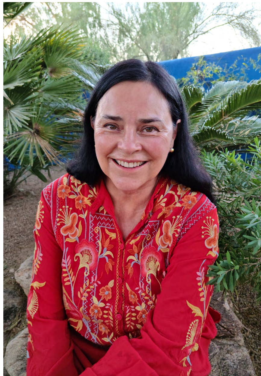
DIANA GABALDON, FÖRFATTARE TILL OUTLANDERSERIEN