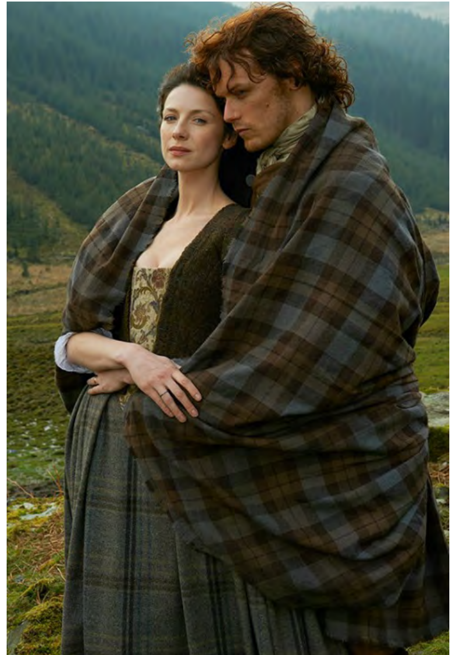
JAMIE OCH CLAIRE I TV-SERIEN OUTLANDER