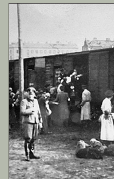
Umschlagplatz, lastplatsen för deportationer.

Ett annat starkt vittnesmål är memoaren skriven av den unge överlevande pianisten Władysław Szpilman. Pianisten skrevs i direkt anslutning till krigets slut och släpptes första gången redan 1946 under titeln En stad dör .