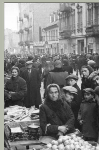
Marknad i gettot, Smoczagatan, 1941.

Gettots befolkning var från början samtliga judar som bott i Warszawa, det vill säga omkring 350 000 personer. Detta innebar att en fjärdedel av hela Warszawas befolkning tvingades samman i ett område som motsvarade mindre än 2,5 procent av Warszawas yta.